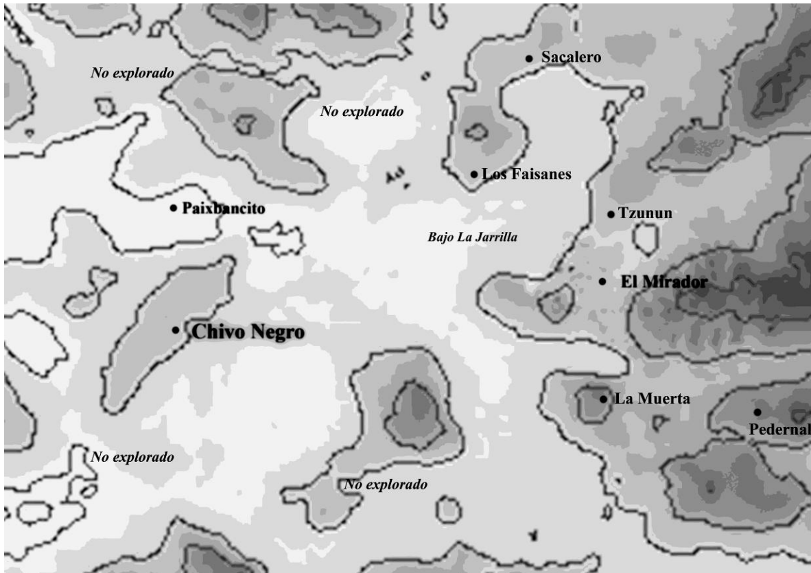
Figura 1 Imagen EDM, que muestra la ubicación de El Mirador, y los asentamientos periféricos asociados (elaborado por Carlos Morales – Aguilar, ©FARES).