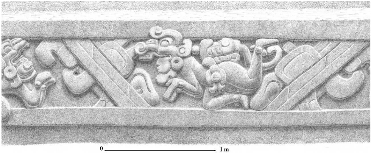
Figura 2 Fragmento de panel inferior, modelado en estuco y asociado a estanques de agua en La Gran Acrópolis Central (dibujo G. Valenzuela).