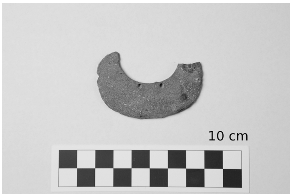
Fig.8: Pectoral de pizarra y pirita (Fotografía de Takeshi Inomata).