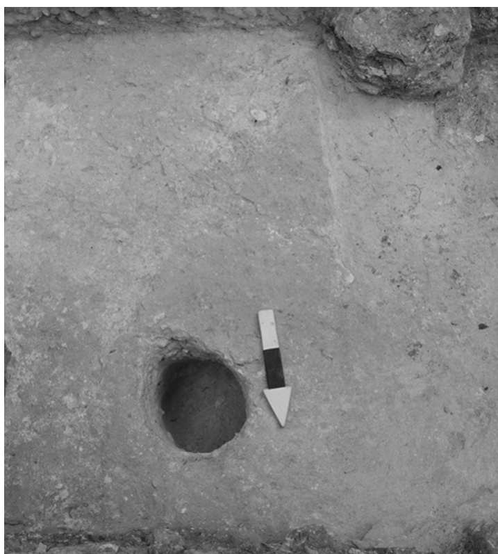
Fig.4: Estructura Saqb'in-3, una plataforma baja de caliza colores rojo y blanco, con un hoyo de poste.