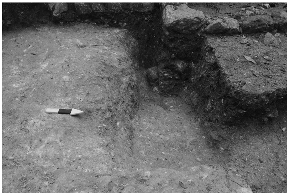
Fig.3: Corte en el suelo natural, en la parte norte del Grupo Karinel.