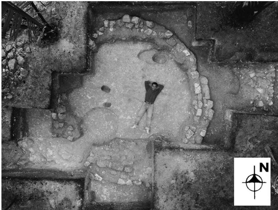
Fig.7: Estructura Sutsu después de la excavación de su relleno y varios rasgos.