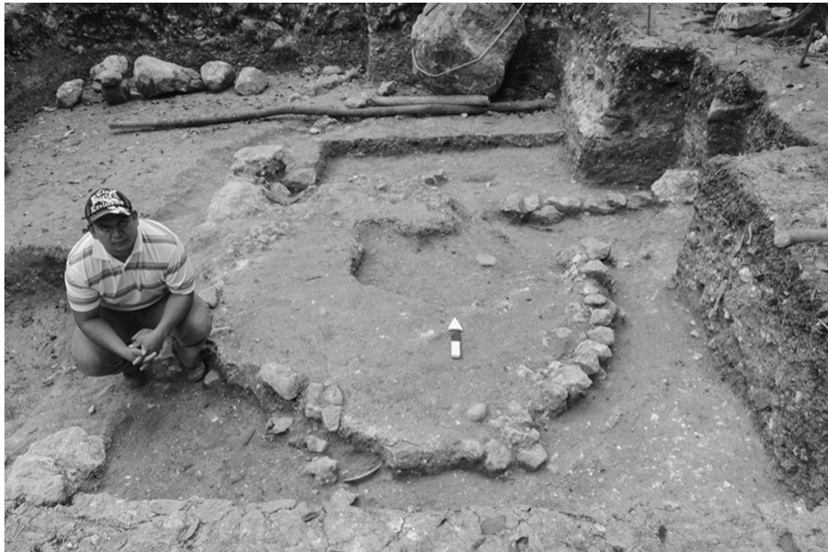
Fig.5: Estructura Pemech-2, una plataforma baja circular que se fecha a la fase Real-Xe 3.