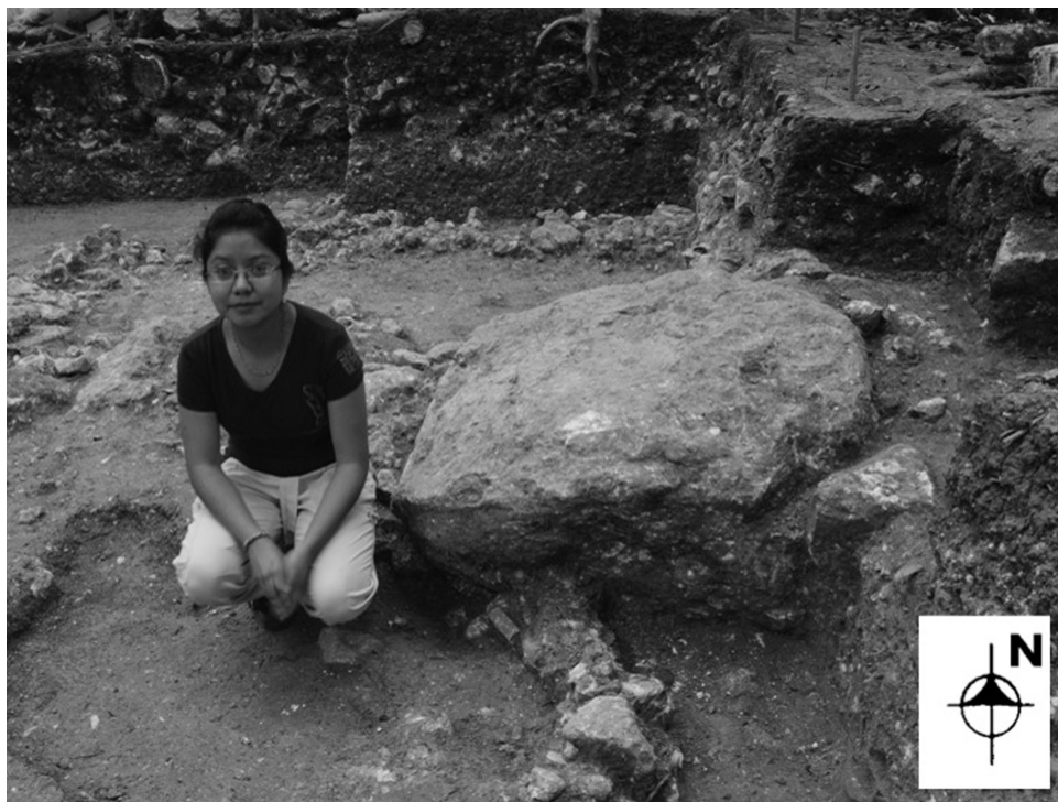
Fig.6: Monumento 3.