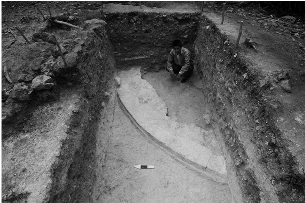
Fig.9: Estructura 47-Sub-3 (Fotografía de Takeshi Inomata).