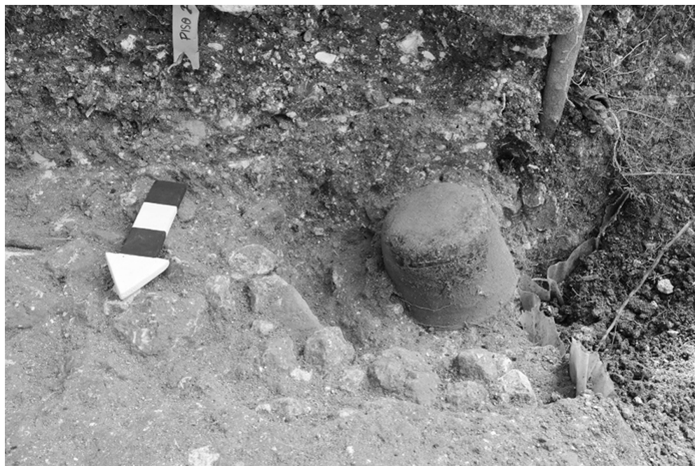
Fig.10: Escondite 175, de una vasija tipo Flor Crema.